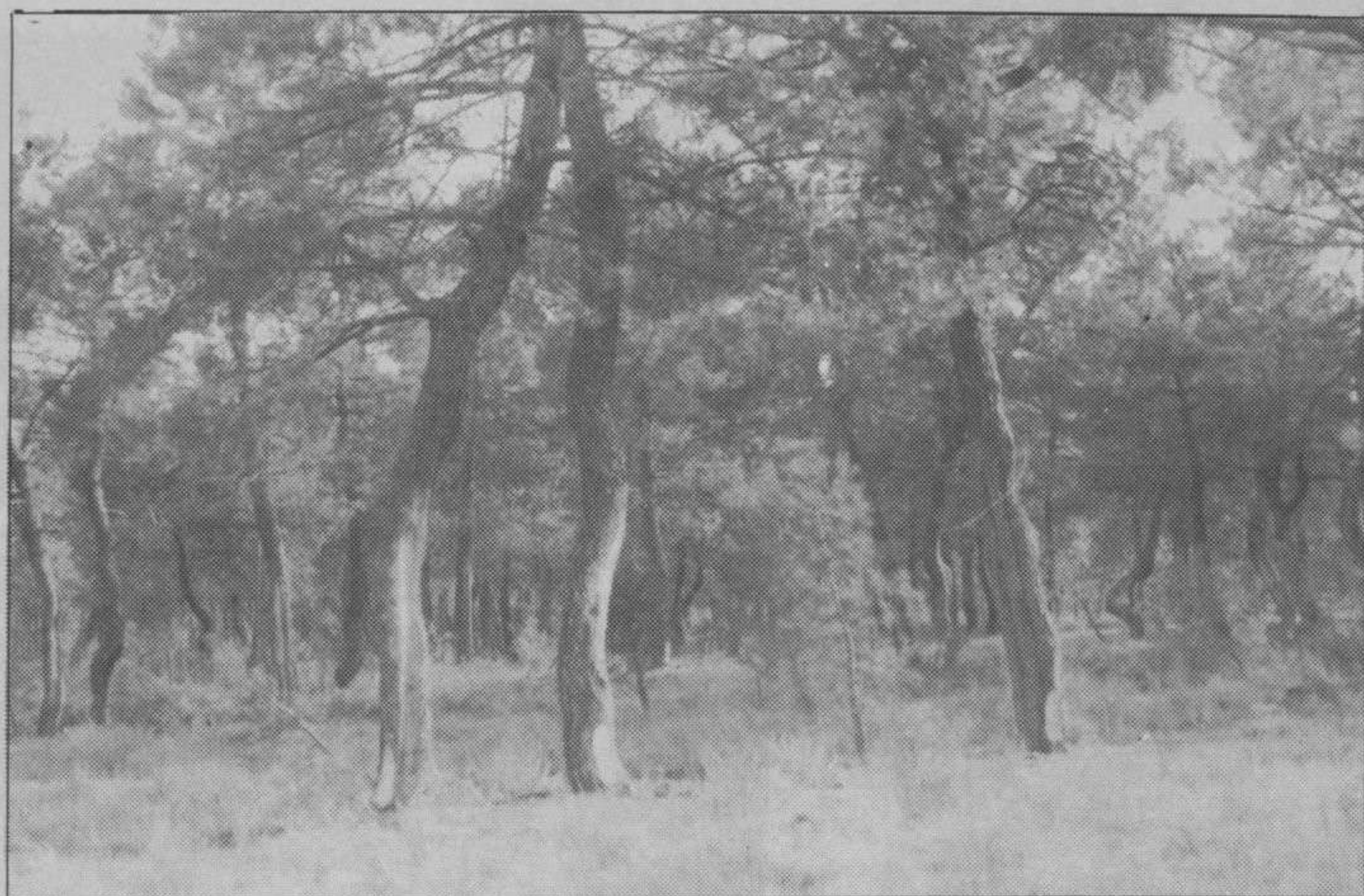
La Tierra de Pinares y las riberas del Cega, en las previsiones del MOPTMA.